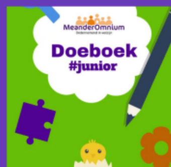
Onze sociaal werkers maken Doeboeken voor thuis voor senioren en junioren