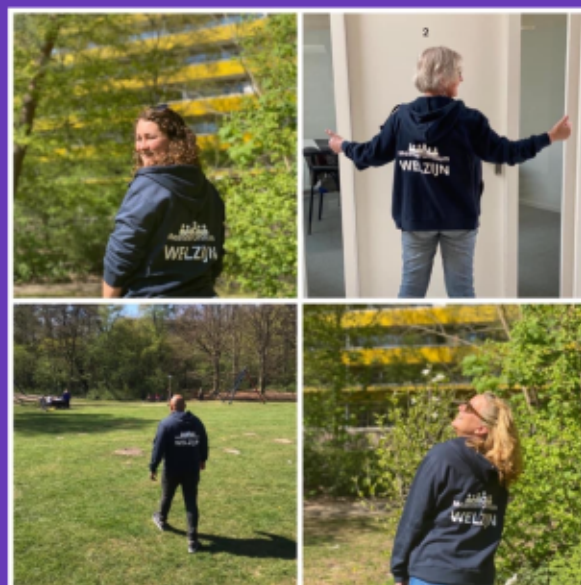
met onze nieuwe bedrijfskleding zijn we zichtbaar in de wijk

Onze rol als MeanderOmnium in deze netwerken valt lang niet altijd op, en zeker in het afgelopen coronajaar vormde dat een risico, maar we blijven een grote rol spelen in het voorkomen van escalatie in wijken, het bij elkaar brengen van groepen en het welzijn van alle bewoners.