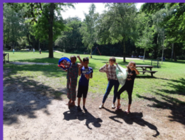
Jeugd ruimt park op, samen met jongerenwerkers