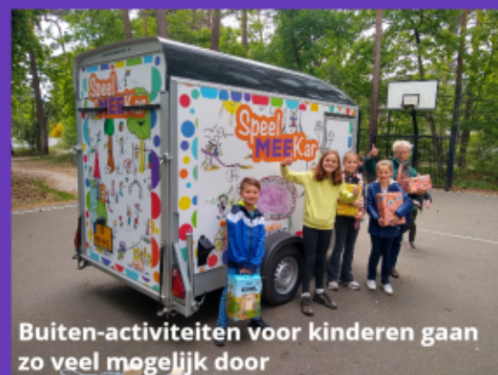
Buiten-activiteiten voor kinderen gaan zo veel mogelijk door