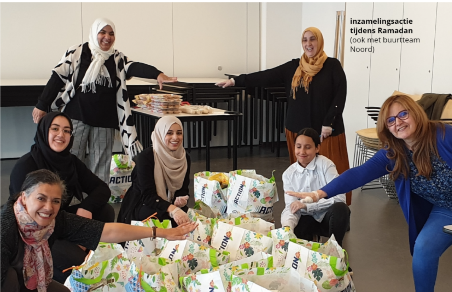
inzamelingsactie tijdens Ramadan (ook met buurtteam Noord)

Onze rol als MeanderOmnium in deze netwerken valt lang niet altijd op, en zeker in het afgelopen coronajaar vormde dat een risico, maar we blijven een grote rol spelen in het voorkomen van escalatie in wijken, het bij elkaar brengen van groepen en het mooier maken van de wijk Zeist-West.