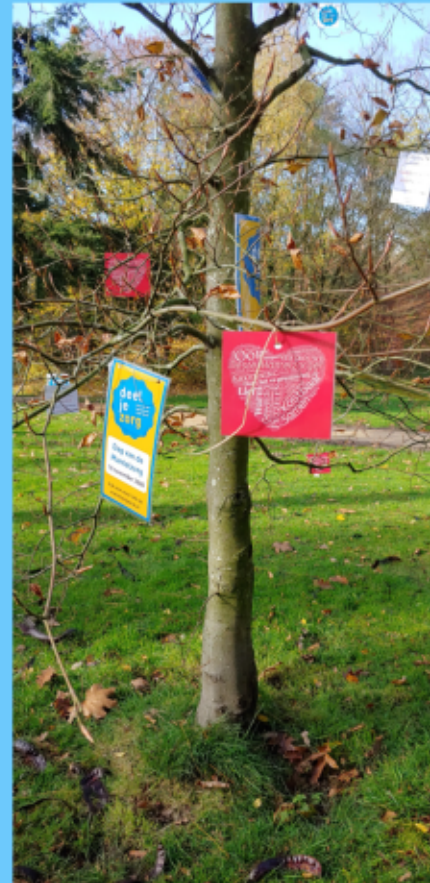
de mantelzorgboom in Zeist

Mantelzorger: “U bent de eerste die informeert hoe het met mij gaat”!