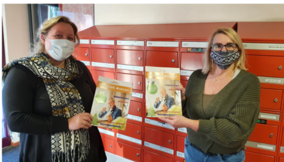
Sociaal werkers in Noord en Centrum maakten Doeboeken voor thuis en deelden deze uit in de wijken

MeanderOmnium zocht in het najaar 2020 contact met de Kringloopwinkel om te onderzoeken of zij willen deelnemen aan een op te zetten naai-atelier op de 1ste etage. Deze samenwerking is van start gegaan.