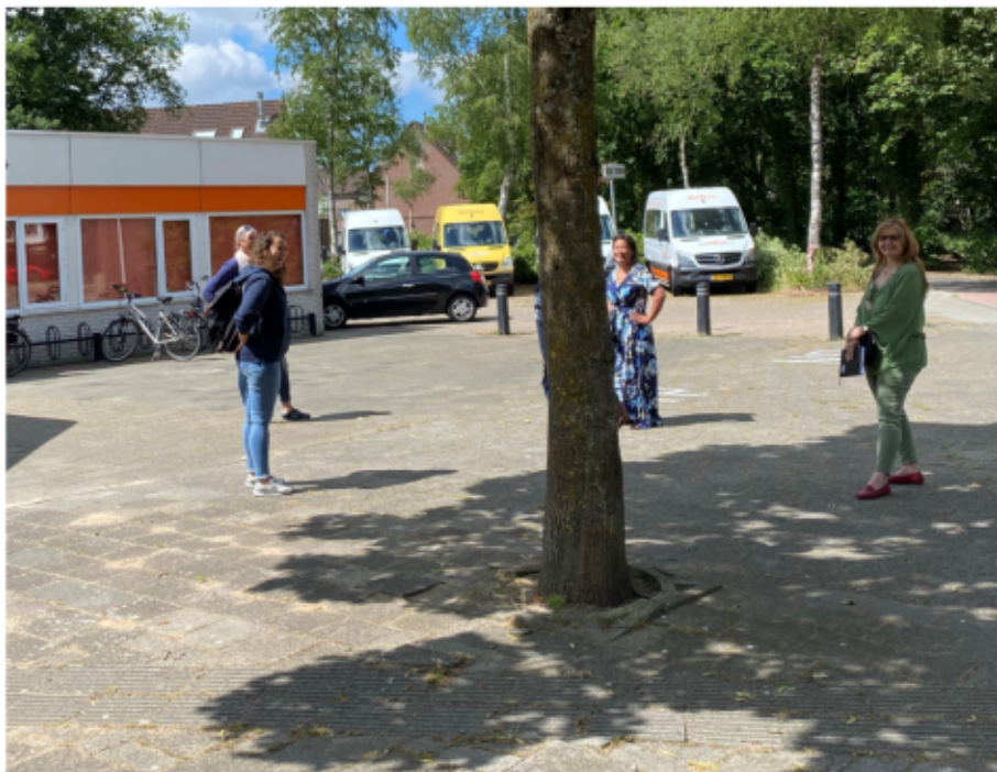
werkoverleg in coronatijd

Daarnaast blijft 't Noorderpunt een locatie in de wijk Vollenhove voor zaken als het wekelijkse trombose prikspreekuur of als stembureau tijdens de verkiezingen. Sinds 2020 is er ook een tweede peuterlokaal gecreëerd in 't Noorderpunt omdat de Rehobotschool het lokaal terugvroeg zo de behoefte aan opvang te kunnen bijbenen. Sinds de eerste lockdown in maart zijn alleen de minimale medewerkers aanwezig. Wel blijven de belbuschauffeurs hier elkaar ontmoeten voor hun dienst zodat we nog steeds mensen naar hun afspraken kunnen brengen.